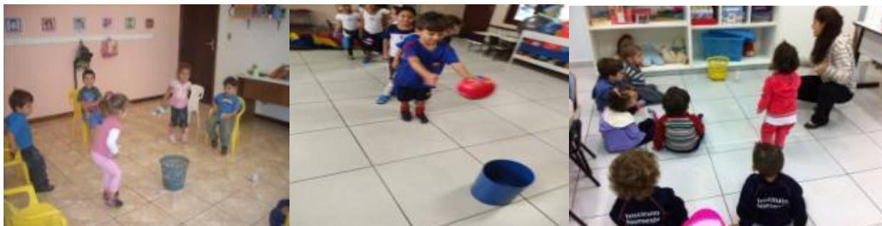
Imagem da atividade.